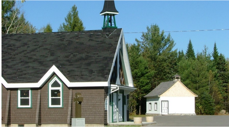
La chapelle St. Joseph et l'école du 4 e Rang

En 2000-2001, alors que le ministère des Transports planifiait l'agrandissement du boulevard Jacques-Cartier (route 369), la Société historique de Shannon a demandé à la municipalité d'acquérir et de conserver un petit bâtiment à ossature de bois situé près du 306 boulevard Jacques-Cartier qui était autrefois une école de rang. En 2003, il a été déplacé à côté de la chapelle St. Joseph, 94, rue Saint-Patrick. L'école du 4 e Rang a été désignée monument historique en 2005.