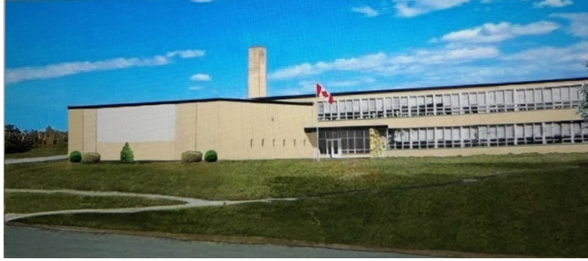
École Sainte-Jeanne d'Arc

En 1972, la Commission scolaire municipale de Shannon est dissoute.