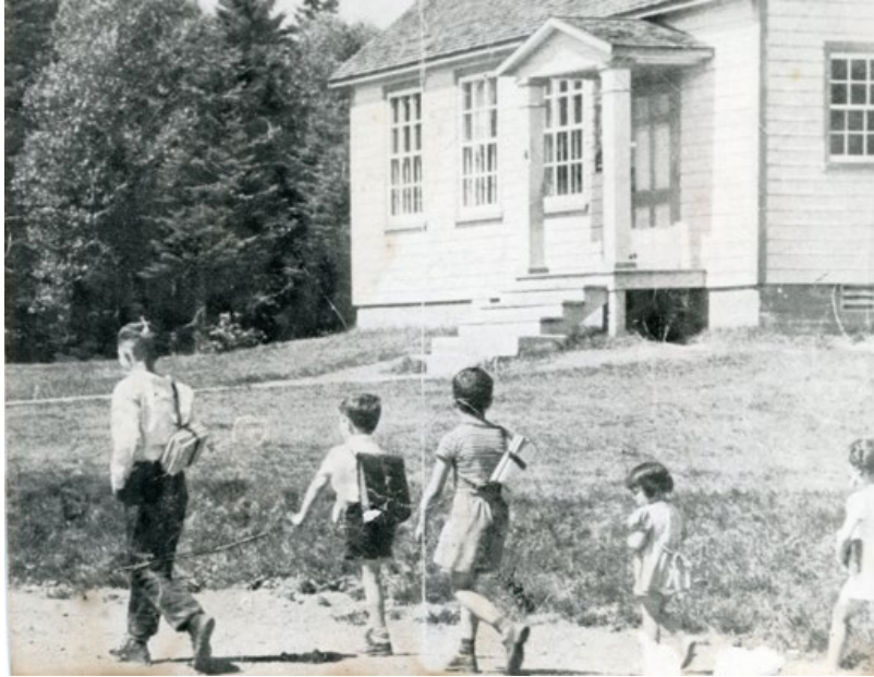
Les enfants de la famille Floyd devant l'école Powerhouse

En 1948, une école bilingue, Shannon N° 3, a été construite sur le lot 271, à côté de la chapelle Saint-Joseph. Localement, on l'appelait l'école Powerhouse .