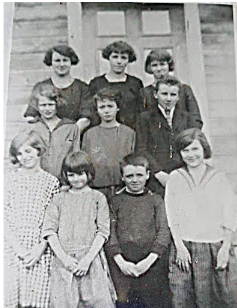
Étudiants d'une école du 5 e Rang, circa 1923